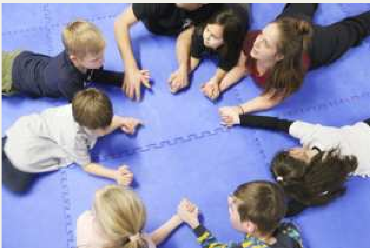
Fotografie byly pořízeny během projektových aktivit a jsou zveřejněny se souhlasem všech zúčastněných.